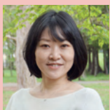
認定特定非営利活動法人 アジア・コミュニティ・センター 21

アジアの人々や現地団体とのつながりを大切に、20年にわたり活動を続けてきた本団体は、運営体制の移行や支援者の高齢化を見据え、事業承継と組織基盤の強化に取り組みました。