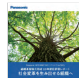
組織基盤強化 20年節目評価レポート