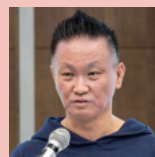
特定非営利活動法人 こどもソーシャルワークセンター

新たな資金調達や人材参画の可能性を広げ、持続可能な組織運営への基盤を築きました。