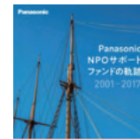
NPO サポートファンドの軌跡

https://holdings.panasonic.jp/npo_summary.html