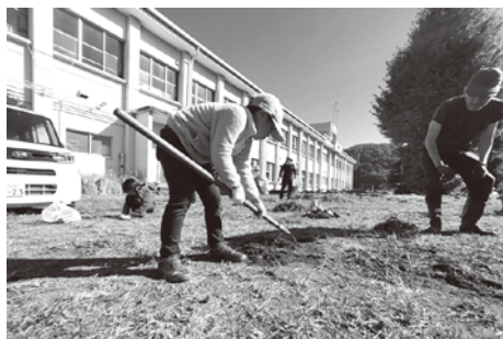
【青沼地区区長会主催：さやか星小学校の草取り実施】 学校初の地域連携に、総勢 60名以上が参加し交流しました